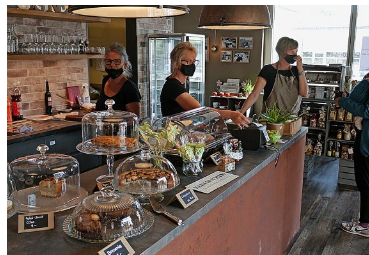
Viel Betrieb ist auch im Kafi Ziegelstei auf der anderen Seite des Ziegeleiplatzes.

an. «Mit diesem Platz gewinnt das Dätt nau definitiv an Lebensqualität», sagt eine ältere Dame, die bei einem Cappuccino schmunzelnd die heranspazierenden Nachbarn beobachtet. Endlich, sagen auch andere, müsse man