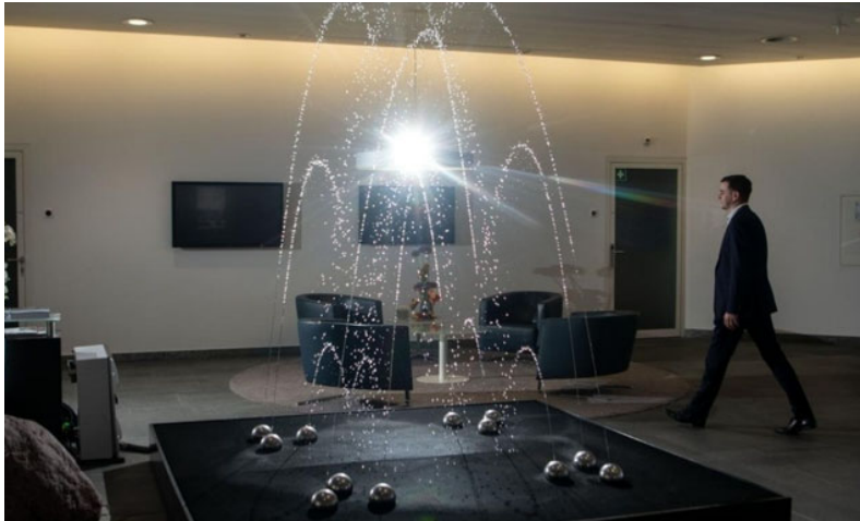
Das ist bloss das Modell: Das Aquaretum en miniature zeigt die seismischen Aktivitäten live im Kleinen.

Am Mittwoch wird das Aquaretum vor dem Hafen Enge eingeweiht. Wir waren zu Gast bei der exklusiven Vorpremiere des neuen Wasserballetts.